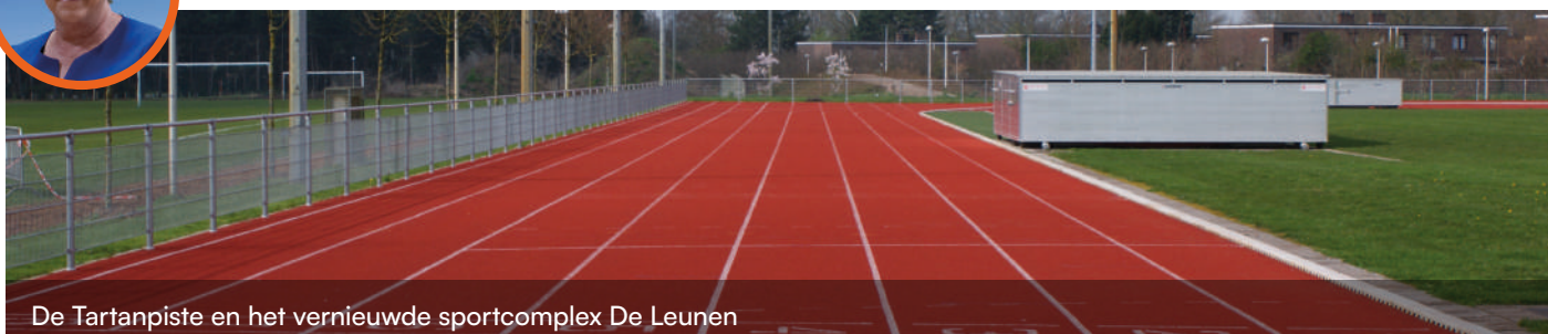
De Tartanpiste en het vernieuwde sportcomplex De Leunen