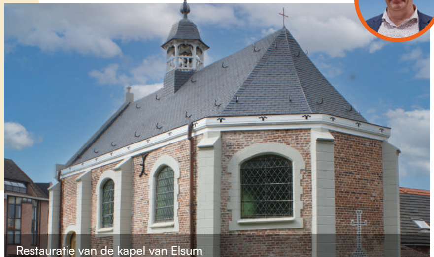
Restauratie van de kapel van Elsum

We vernieuwden oude rioleringen in de Europawijk, Groenstraat, Tessenderloseweg, Retieseweg, Gasthuisstraat en de Pas. Daarnaast zetten we ons in voor de bescherming van historische gebouwen, zodat ook toekomstige generaties ervan kunnen genieten.