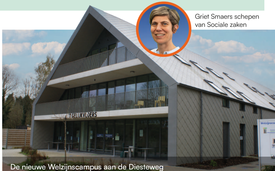
De nieuwe Welzijnscampus aan de Diesteweg