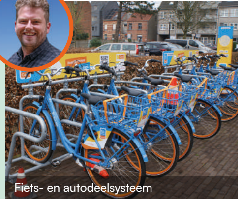
Fiets- en autodeelsysteem