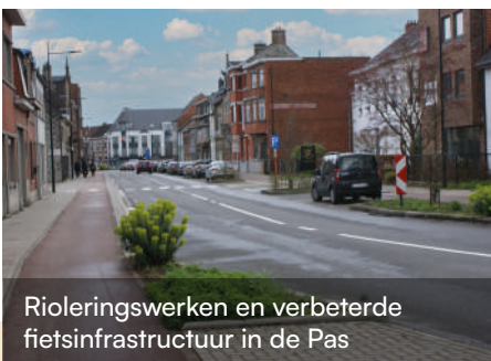
Rioleringswerken en verbeterde fietsinfrastructuur in de Pas