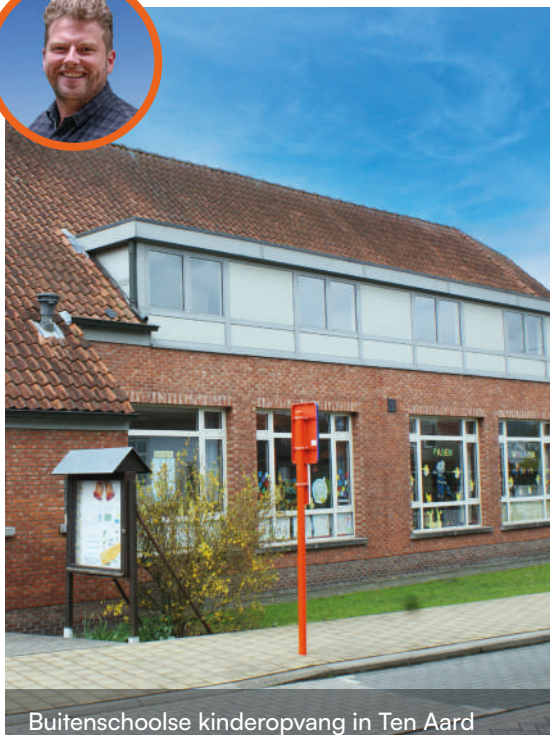
Buitenschoolse kinderopvang in Ten Aard

Met Wedbos en Luysterbos kiest Geel voor een eigen openbaar woonzorgcentrum en een lokaal dienstencentrum. Door samenwerking met alle zorgverleners garanderen we de beste zorg voor elke fase van het leven.