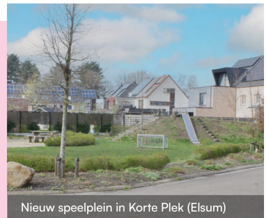
Nieuw speelplein in Korte Plek (Elsam)

We hebben onder meer geïnvesteerd in de vernieuwing van speelplaatsen, de aanleg van (nieuwe) speelpleintjes en een chillzone op de parking van de Pas. Daarnaast zijn we bijzonder trots op de investeringen in ons jeugdcentrum De Bogaard en omgeving, waaronder een nieuw skatepark, een kinderboerderij en een kleuterzone. De jeugd is de toekomst en bij CD&V Geel zetten we ons volledig in om hen alle kansen te geven die ze verdienen.